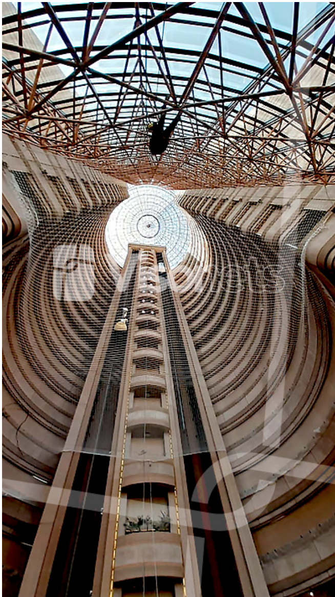
filet de sécurité type S - forme spéciale

Voyons l'un des derniers projets spéciaux. Un client est venu nous demander s'il était possible de faire un filet de sécurité avec une forme très spéciale. Ils doivent l'installer pour protéger les personnes qui tombent et les débris dans les travaux de maintenance à l'intérieur d'un grand hôtel classé. La solution avec le filet, située juste dans le hall, devait protéger le travailleur et les clients de l'hôtel.