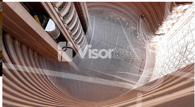
filet de sécurité type S - forme spéciale

Par conséquent, notre équipe a conçu le filet de sécurité d'image. Entièrement adapté à la forme du bâtiment.